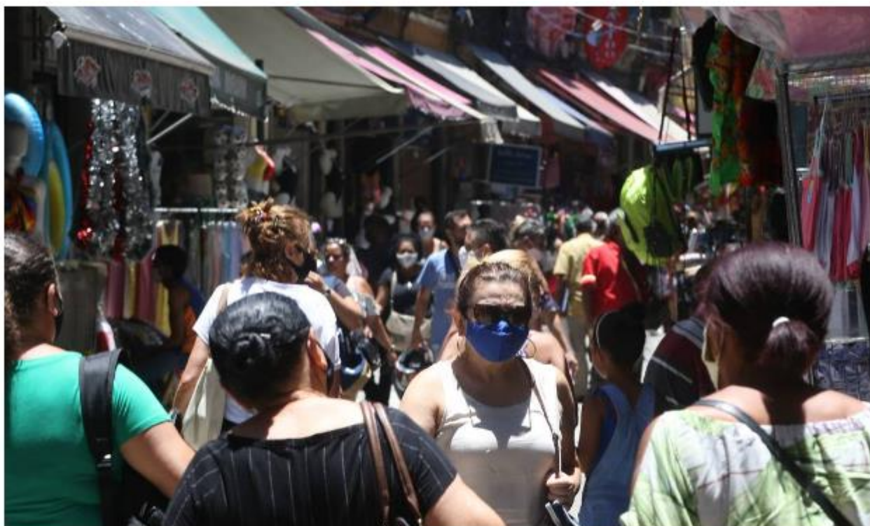
Brasil teve retração de 0,1% do PIB no terceiro trimestre

02/12/2021 - 09:57 / Atualizado em 02/12/2021 - 14:04